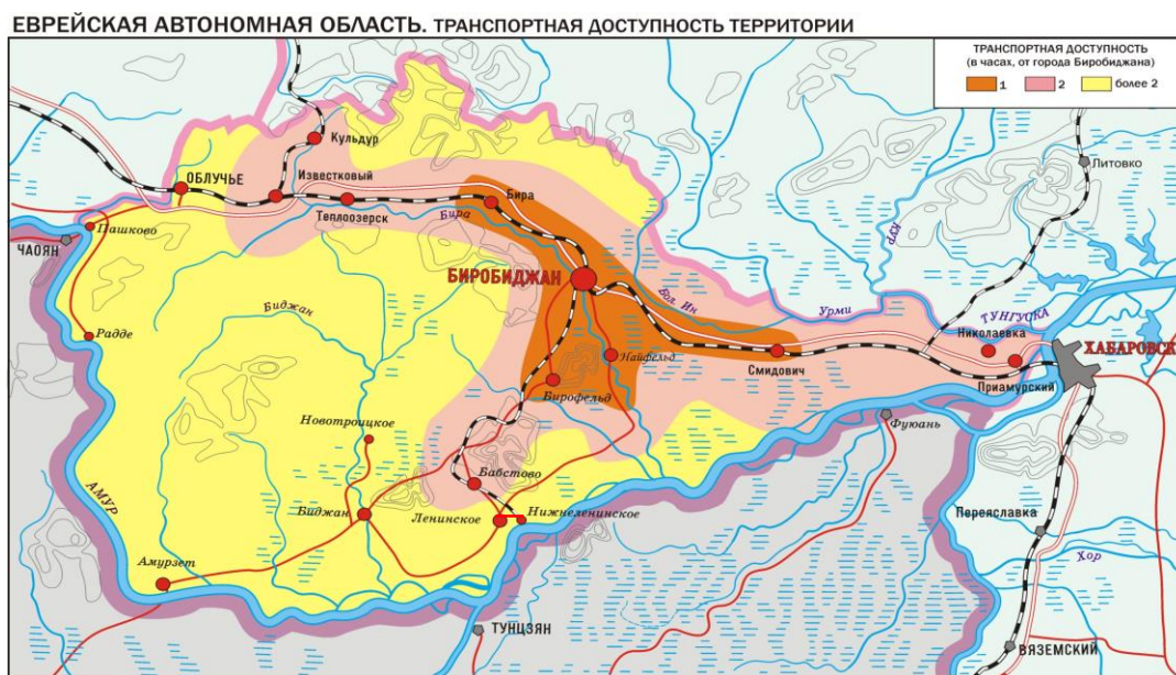
Рисунок 2. Транспортная сеть ЕАО

6.3. Решение этих задач предполагает реализацию ряда стратегических проектов: